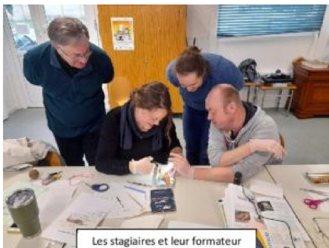
Les stagiaires et leur formateur